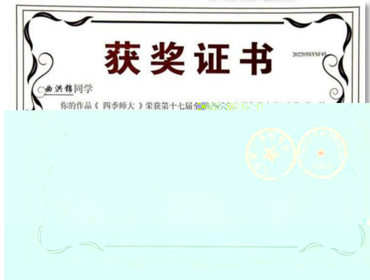
十六、十七 全 作 二