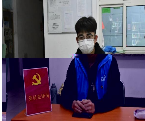
党员先 30 余