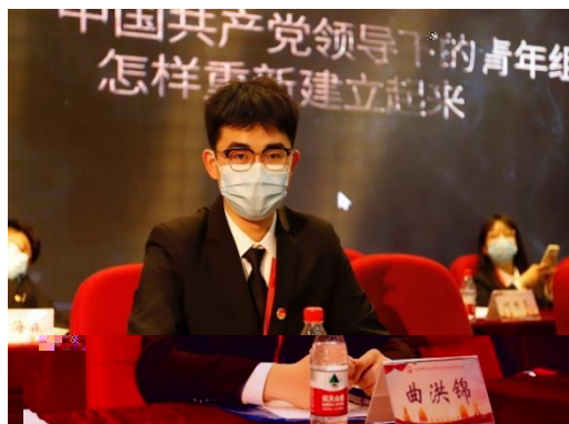
三 代 会 代